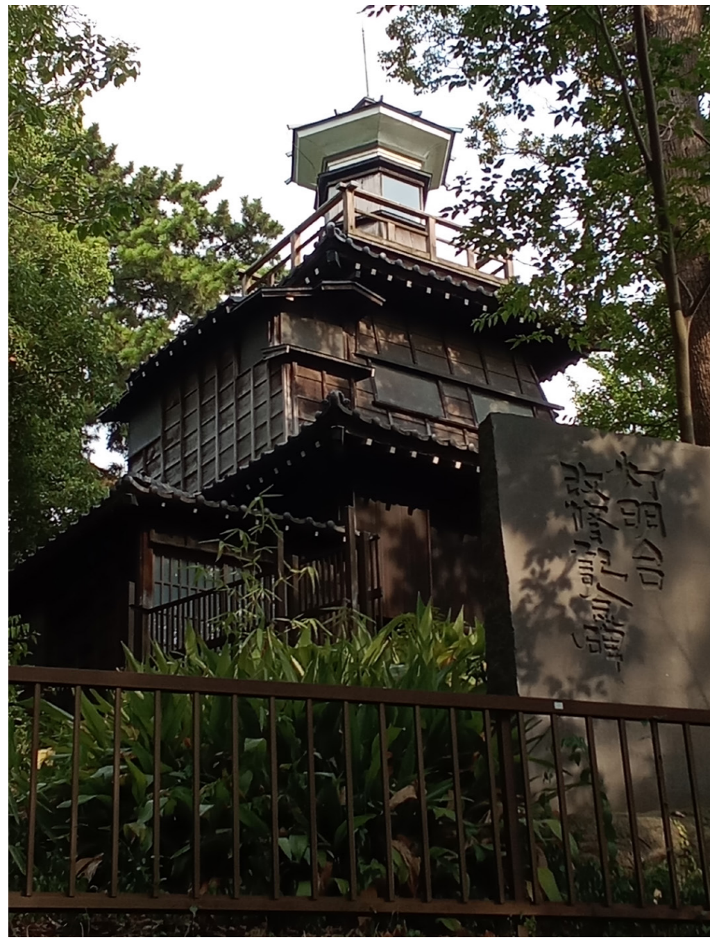
船橋大神宮に佇む灯明台

船橋大神宮にひっそりと佇んでいる灯明台を知っているだろうか。千葉県指定有形民俗文化財に指定されている和洋折衷のモダンな建物だ。1、2階は和風、3階は西洋式灯台のデザインを取り入れている。昔は灯明台ではなく、常